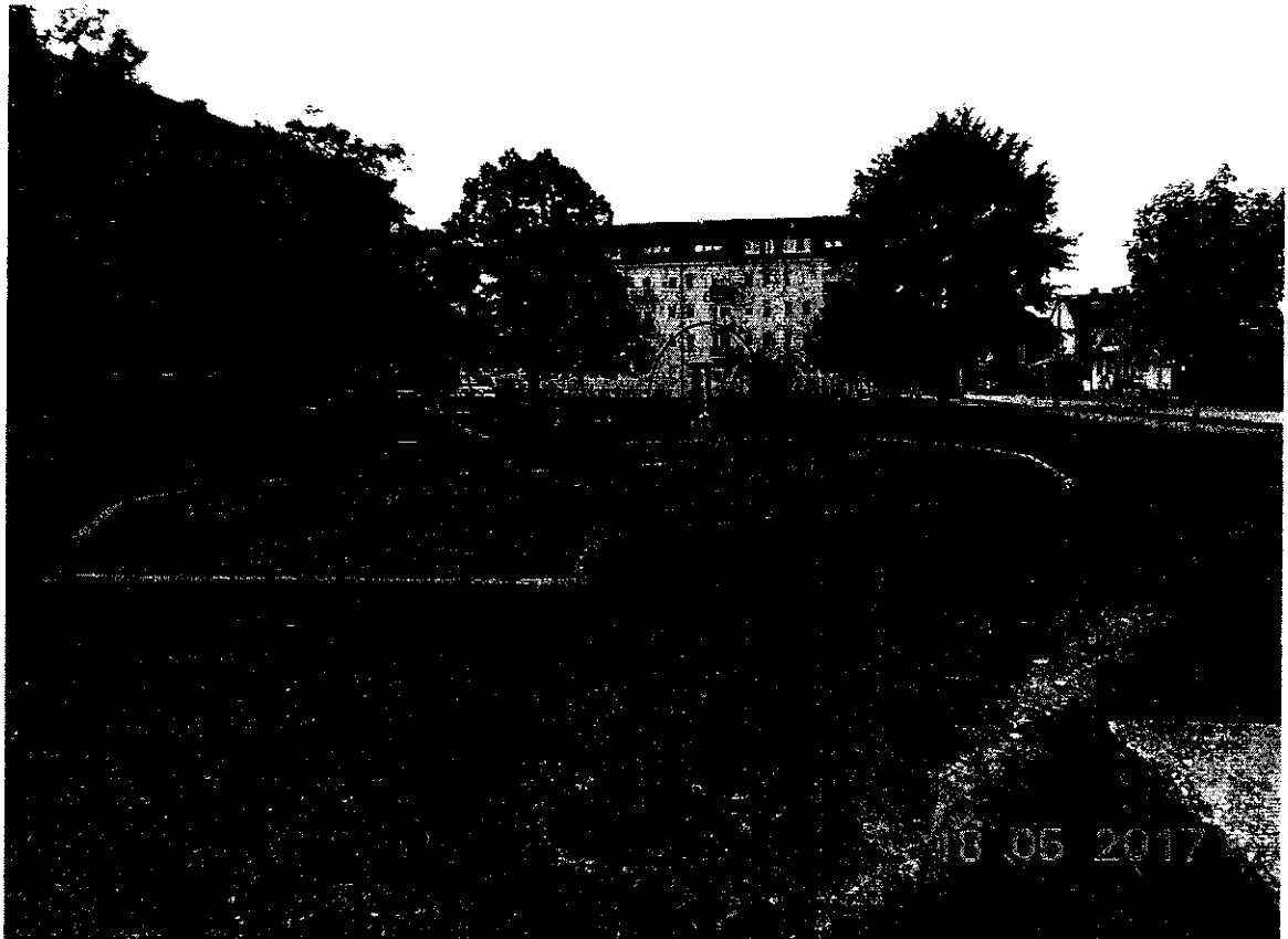
a szobor a tervezett helyén