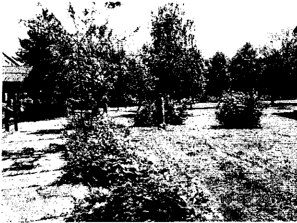
a szobor jelenlegi helyén