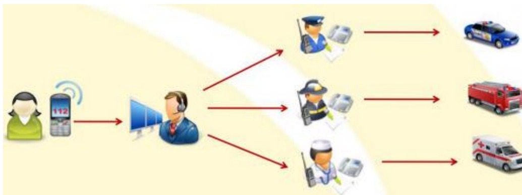
1. ábra Risztás fázisai

A parancsnokság és az Aggteleki Katasztrófavédelmi Őrs megfelelő mennyiségű és állapotú EDR kézi és stabil rádióval rendelkezik, minden gépjárműbe épített rádió és kézi rádió üzemképes.